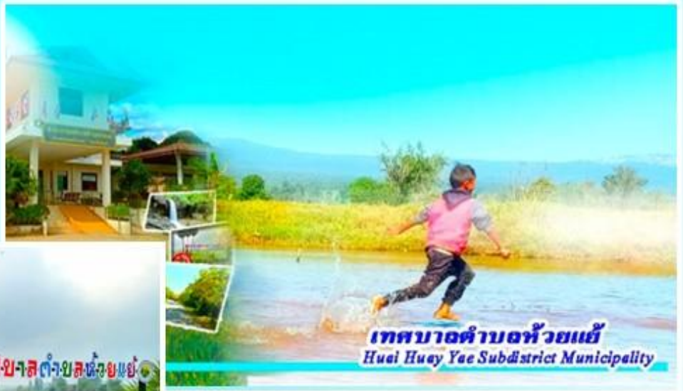
เทศบาลตำบลห้วยแย้ Huai Huay Yae Subdistrict Municipality